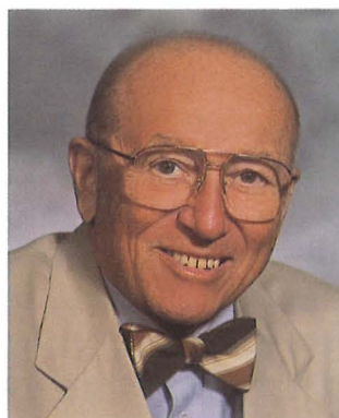
ジョセフ・F・エンゲルバーガー博士