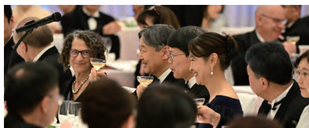
■ ご乾杯をされる天皇陛下