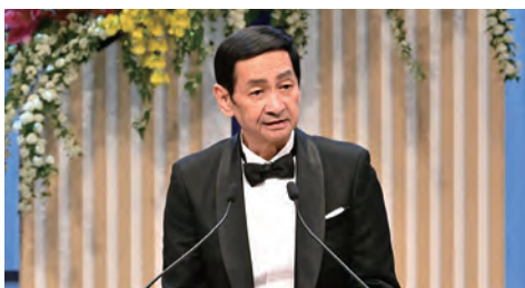
■ 関口昌一 参議院議長 祝辞