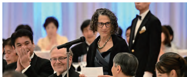
■ シンシア・ドワーク 博士