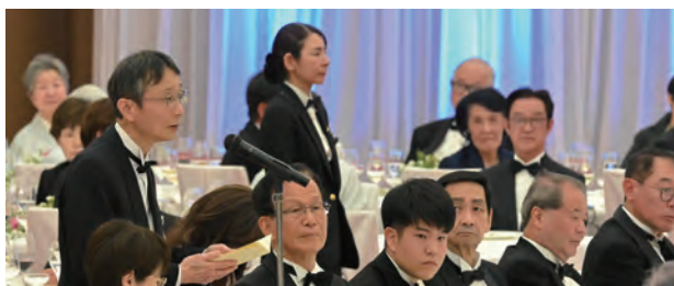
■ 今崎幸彦 最高裁判所長官 祝辞