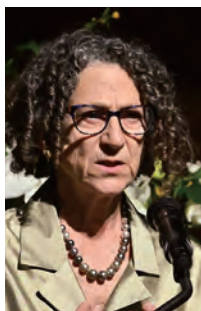
シンシア・ ドワーク博士