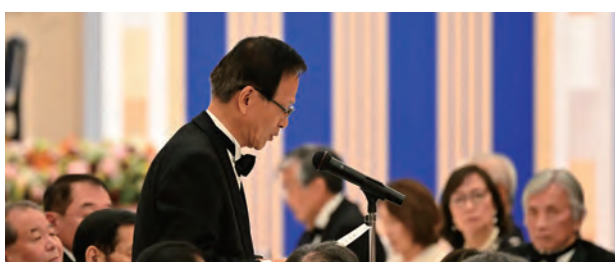
■ 審良静男 博士