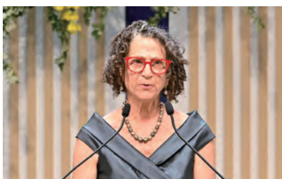
■ シンシア・ドワーク 博士

2026年Japan Prize（日本国際賞）の授賞式は、天皇后陛下のご臨席のもと、森英介 衆議院議長、関口昌一 参議院議長、今崎幸彦 最高裁判所長官、松本洋平 文部科学大臣をご来賓としてお迎えし、約600名が出席して新国立劇場で盛大に開催されました。授賞式では、国際科学技術財団 小宮山宏会長から各受賞者に賞状と賞牌が贈られました。受賞者は賞牌を掲げて会場の拍手に応え、受賞の喜びを語りました。