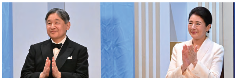
■ 受賞者を祝福される天皇后陛下